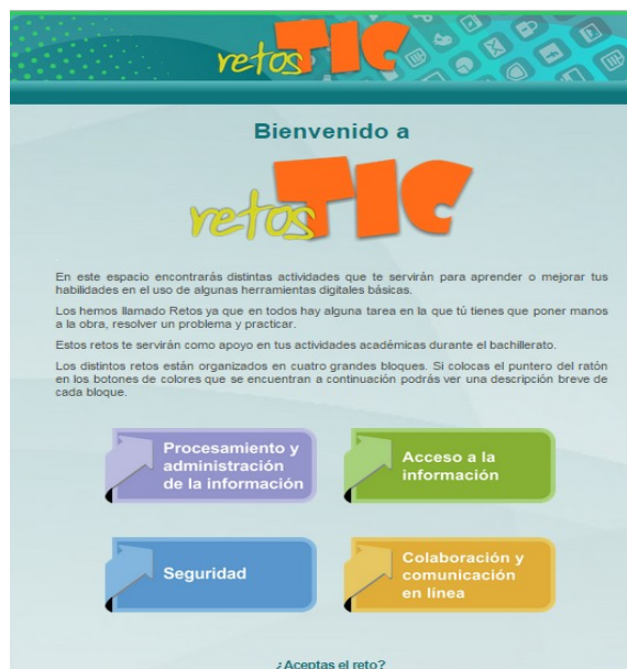
Fig. 2 Portada del sitio web de retos TIC. http://retos.educatic.unam.mx

En el curso se abordan distintas temáticas relacionadas con las tecnologías de la información y la comunicación, mismas que están organizadas en cuatro bloques.