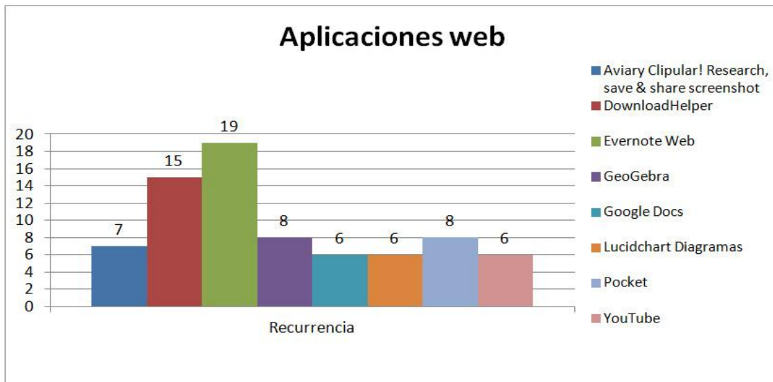
Gráfica 2. Aplicaciones web más recurrentes en la actividad